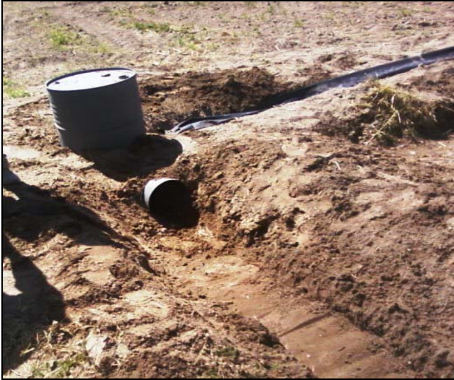
Fig 4. Derivación con tambor en codo desde acequia a la manga en cabecera

Las mangas son ciegas, es decir no vienen de fábrica con las ventanas colocadas. Además, se pueden presentar tramos solamente para la conducción, por ejemplo desde una perforación hasta la cabecera del cultivo. Las ventanas se insertan en el lugar y con la tubería llena de agua. La inserción se realiza con una herramienta especial diseñada y provista por el fabricante.