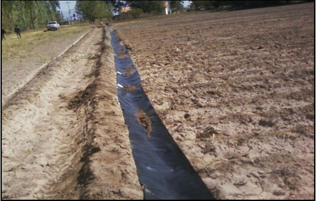
Fig. 2. Manga desplegada en la cabecera

Las mangas se despliegan sobre la cabecera siendo necesario antes la conformación de un pequeño surco “sostén” levemente elevado en relación a las regueras (Fig. 2).