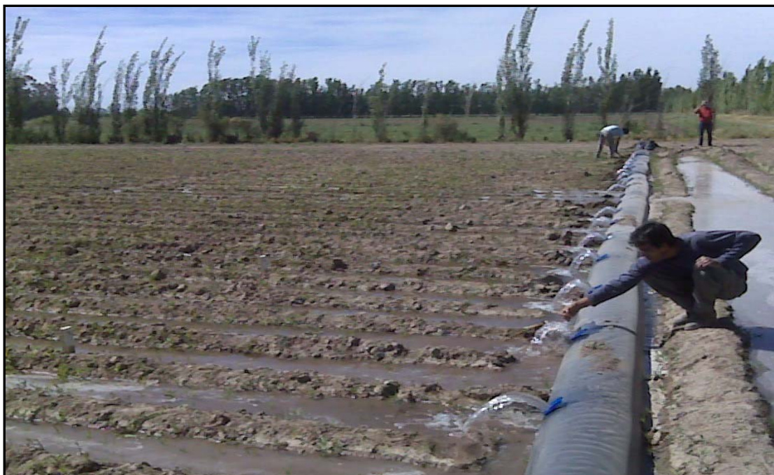
Fig. 5. Funcionamiento en un riego de siembra en maíz.

La posibilidad de colocación manual de las ventanas permite también que puedan ser dispuestas a diferentes distancias. Por ejemplo a 2-2,50 m para melón, a 1,50 m para tomate, 0,70 m para ajo, etc.